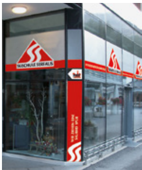
Grafik: mountain-management.com, Lochau

Weitere Informationen finden Sie unter www.skischule-serfaus.com Sämtliche Preise in € (EURO) – Änderungen und Irrtümer vorbehalten!