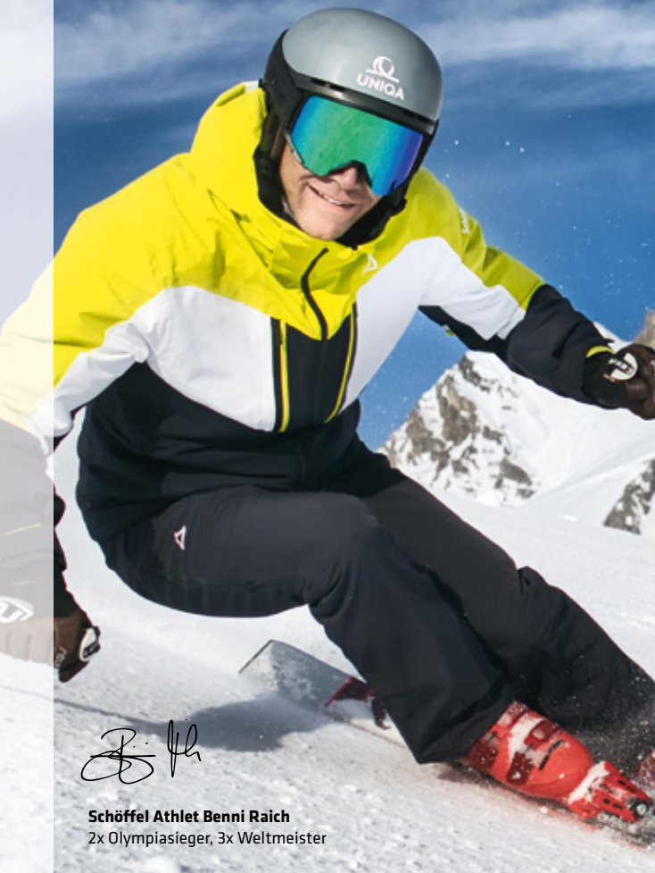
Schöffel Athlet Benni Raich 2x Olympiasieger, 3x Weltmeister